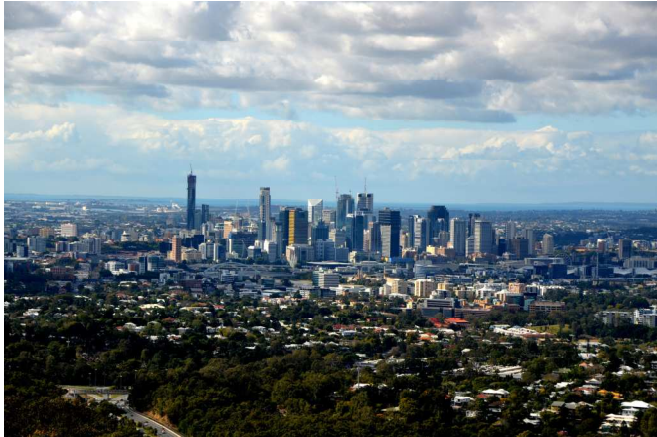
Skyline von Brisbane

Meiner Meinung nach war es eine sehr gute Erfahrung nach Australien zu gehen. Ich habe viele neue Menschen kennen gelernt, einen neuen Lebensstil erfahren und viele tolle Sachen erlebt. Zudem hat es großen Spaß bereitet fast die ganze Zeit in der englischen Sprache zu kommunizieren.